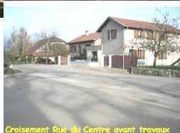
Croisement Rue du Centre avant travaux