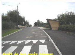
Arrêt de bus après travaux