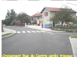
Croisement Rue du Centre après travaux