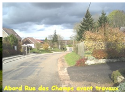
Abord Rue des Champs avant travaux

N°19 (sept 2012) : Aménagements de sécurisation de la grande rue et de la rue du centre, dos d'âne, trottoirs et marquages / Création du lotissement du Dessus de l'Aval