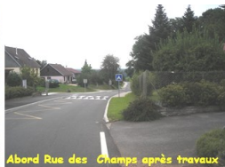
Abord Rue des Champs après travaux