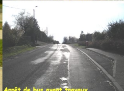
Arrêt de bus avant travaux