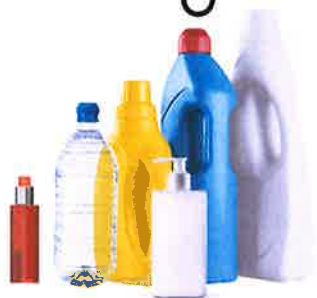
EMBALLAGES PLASTIQUES Bouteilles/bidons/flacons