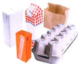
EMBALLAGES EN CARTON Boîtes, carton, briques alimentaires