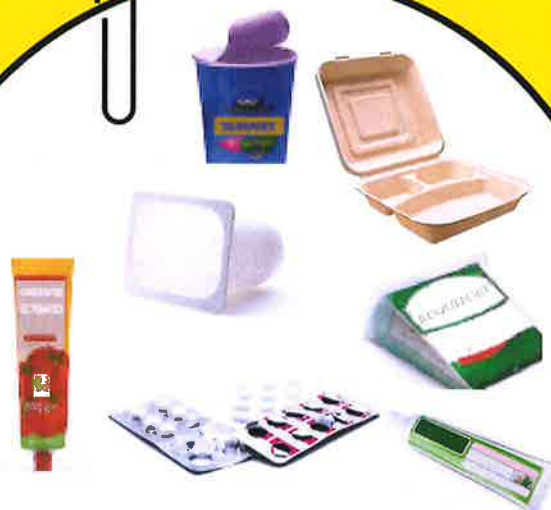
POTS/BARQUETTES/BOÎTES/ SACHETS/FILMS PLASTIQUES