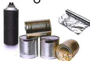
EMBALLAGES MÉTALLIQUES Acier / aluminium