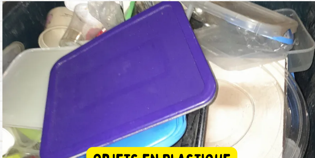
OBJETS EN PLASTIQUE