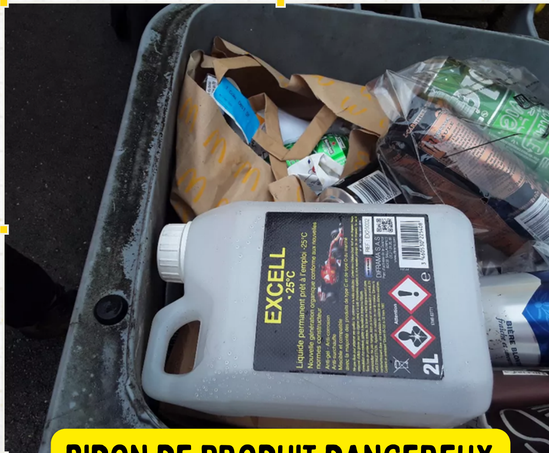
BIDON DE PRODUIT DANGEREUX

MERCI DE DÉPOSER VOS BIDONS DE PRODUITS DANGEREUX EN DÉCHETTERIE.