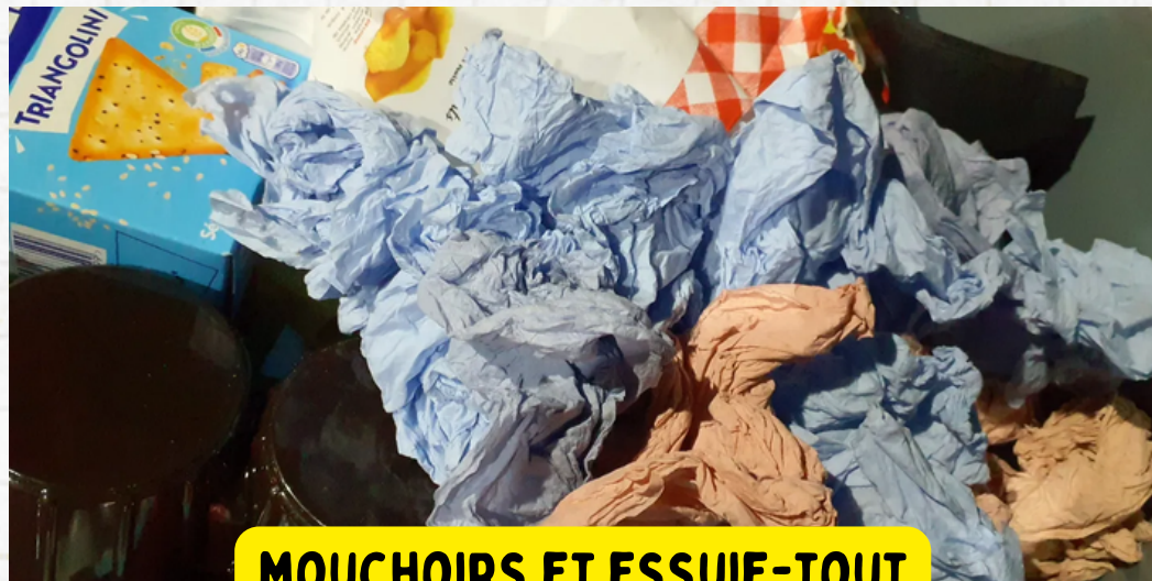
MOUCHOIRS ET ESSUIE-TOUT