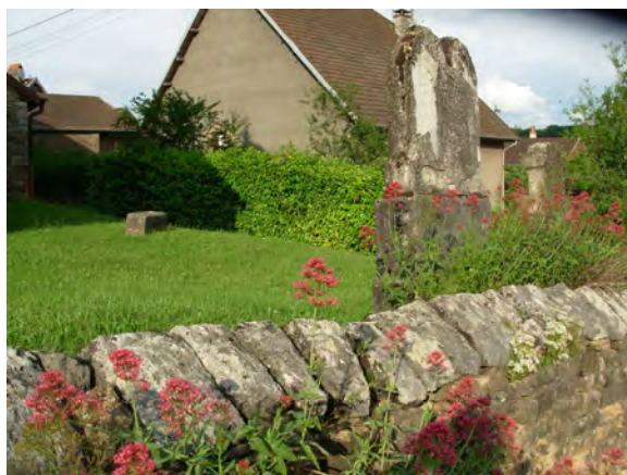
Le vieux cimetière