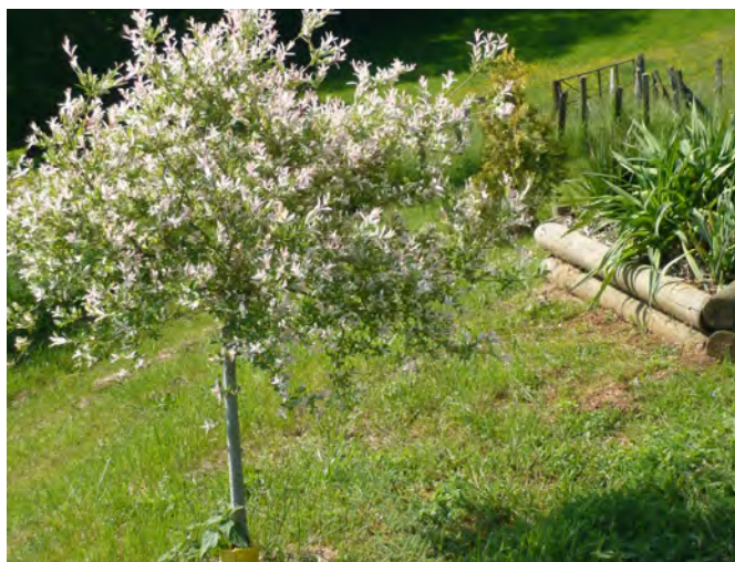
Saule « Crevette » Salix integra