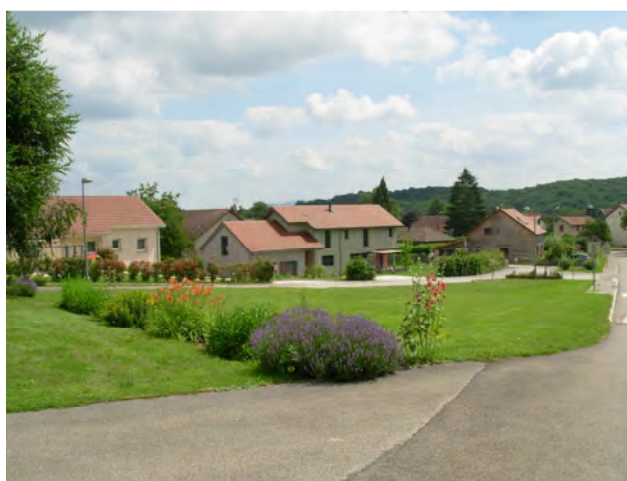
Le nouveau lotissement