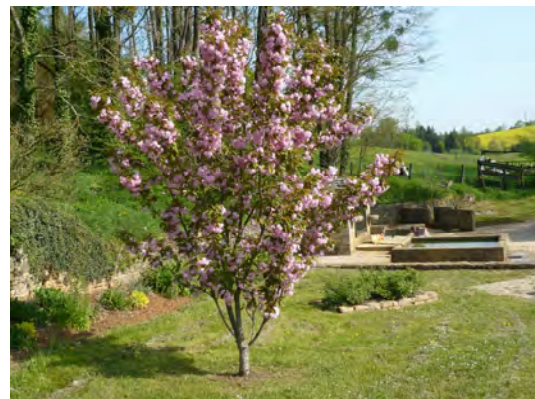
Cerisier du Japon