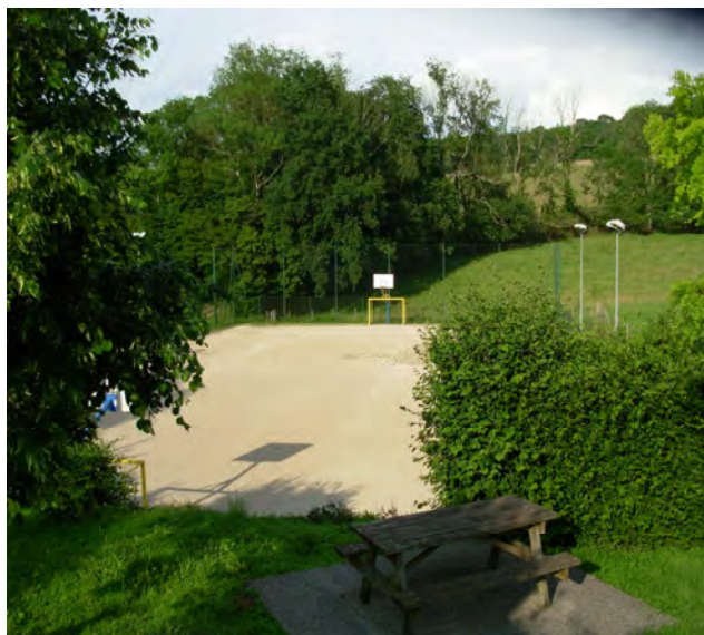
Le terrain multi-activités