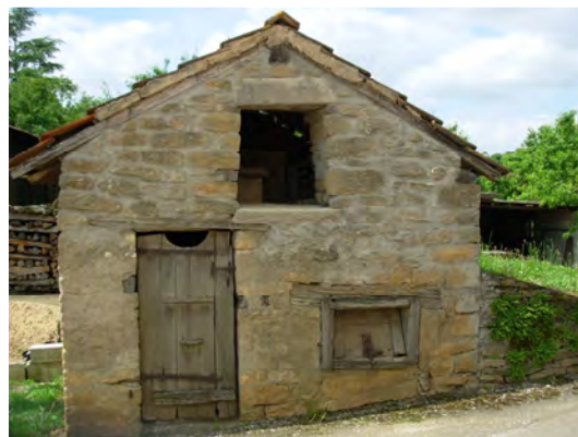
Une soue à cochons