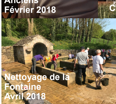
Nettoyage de la Fontaine Avril 2018