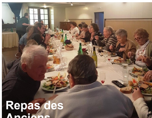
Repas des Anciens Février 2018

Suite à l'AG extraordinaire, de janvier dernier, une nouvelle équipe s'est formée pour animer l'Association la Fontaine [ALF]. Depuis plusieurs activités habituelles et nouvelles ont eu lieu. Toutes ces manifestations sont retracées et plus imagées sur le site de la commune, sous l'onglet de l'Association la Fontaine. Pour tous vos retours, idées ou informations: lafontaineassoplacey@gmail.com