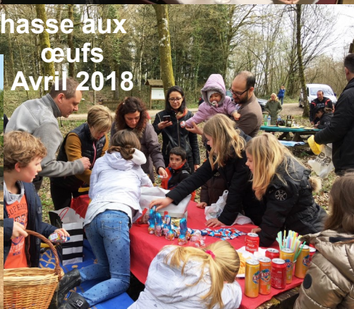
Chasse aux œufs Avril 2018

Et aussi: Atelier Fête des Pères, Coupe du monde football 2018, La Fête de la patate... le programme de fin d'année sera bientôt diffusé!