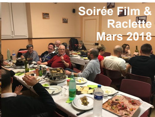
Soirée Film & Raclette Mars 2018